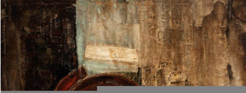
OBRA 1/ OPCION B