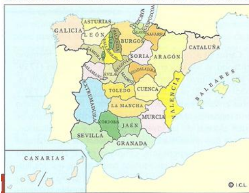
ESTRUCTURA ADMINISTRATIVA DE LA ESPAÑA DEL SIGLO XVIII